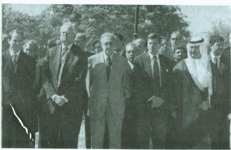
(من اليسار إلى اليمين) ديفيد ريتشموند، بوب بلاكويل، الإبراهيمي، بريمر، الشيخ غازي في جنازة رئيس مجلس الحكم عز الدين سليم، 18 أيار/ مايو 2004